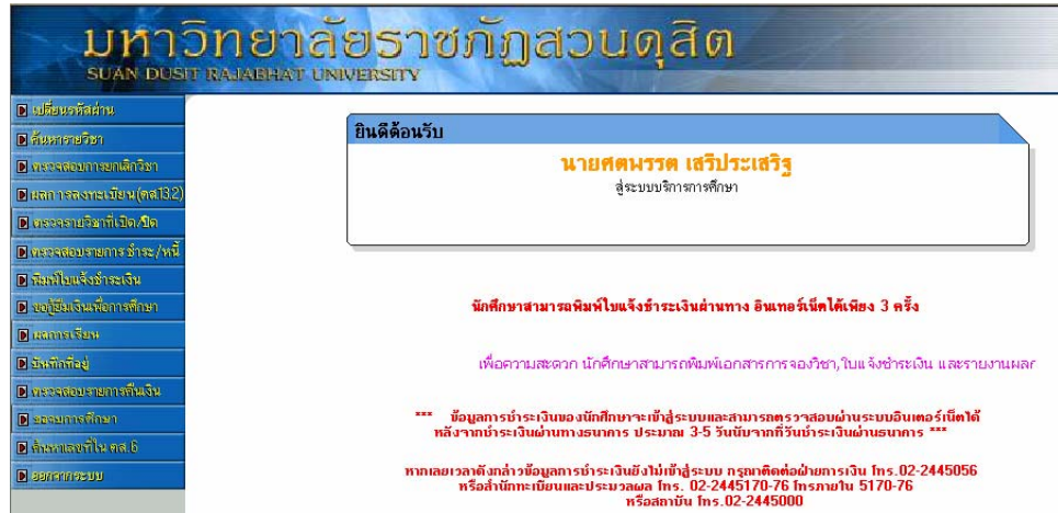
รูปที่ 1.1 หน้าจอหลักของนักศึกษา