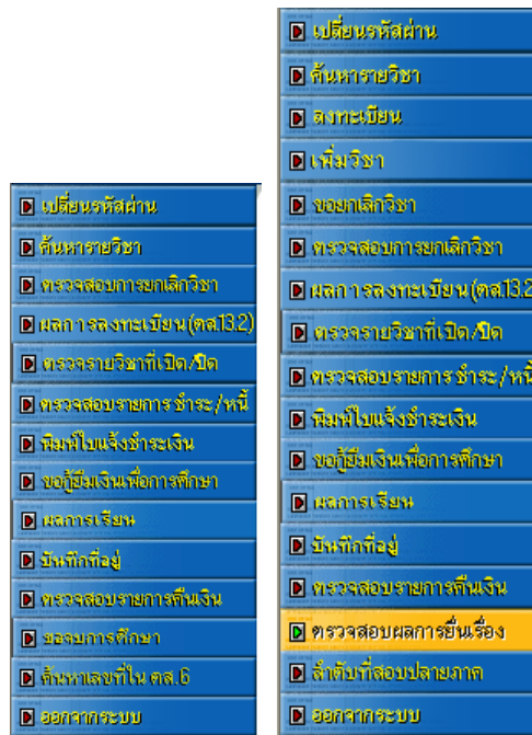
รูปที่ 1.2 หน้าจอแสดงเมนูต่าง ๆ ของการขอสำเร็จการศึกษา

นักศึกษามีฟังก์ชันการทำงานภายในระบบขอสำเร็จการศึกษา ดังต่อไปนี้ (เมนูแสดงดังรูป 1.2)